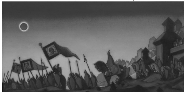
Н. Рерих. Поход князя Игоря