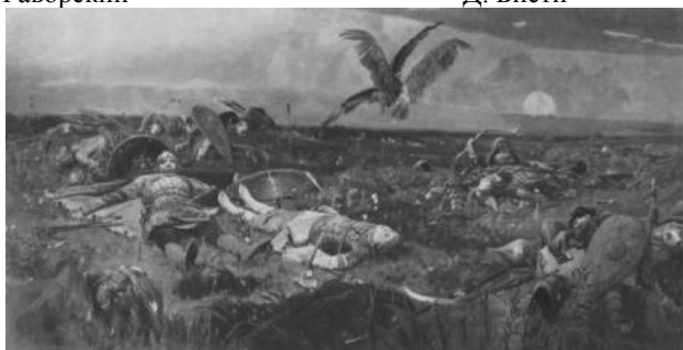
В.М. Васнецов. После побоища. 1880.