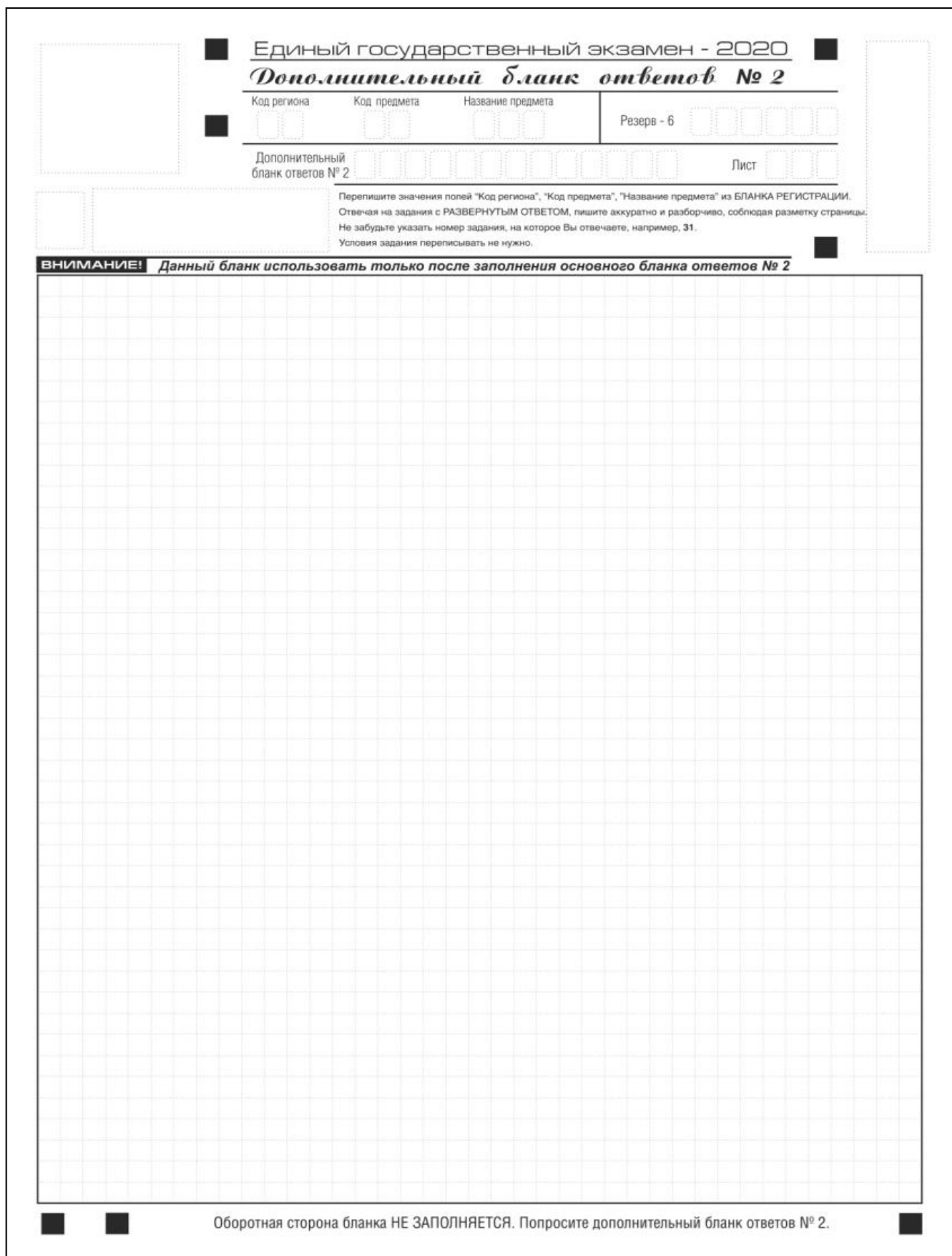
Рис. 15. Дополнительный бланк ответов № 2